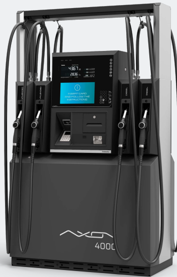
ATÉ 8 MANGUEIRAS