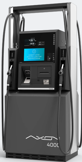
ATÉ 4 MANGUEIRAS